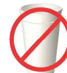
មិនឱ្យមានធុងកែវផឹកទឹកដើមដាយនេះឬសារធាតុគីមីផ្សេងៗទៀតនោះទេ