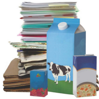
ក្រដាស ក្រដាសហិប (ពង្រាប) និងប្រអប់កាតុងប៉ូណ្លោះ