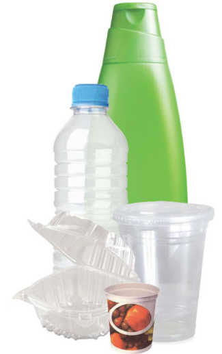
ធុងផ្លាស្ទិកប៉ូណ្លោះ

យកចេញនៅកម្រិតអប្បបរមា លាងចេញនៅពេលណាដែលអាច