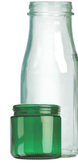
ដបកែវនិងចូតែប៉ូណ្លោះ