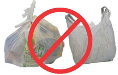
មិនឱ្យមានថ្លើងជាងស្លាមសំណល់គេសង្ឃឹមក្រហមនោះទេ

មិនឱ្យមានថង់ផ្លាស្ទិក ថង់ផ្លាស្ទិកសម្រាប់ដាក់ថង់ផ្លាស្ទិក ឬផ្នែកខាងក្នុងនៃថង់ដែលអាចកែច្នៃបានទេ