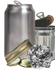
កំប៉ុងលោហៈ សំណនិងក្រដាសស្រោបធ្វើពីលោហៈ